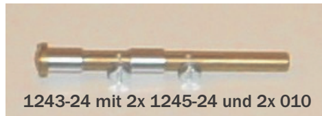
1243-24 mit 2x 1245-24 und 2x 010

Für Linkertvergaser von 1933-1965: Flathead VL 1933-35, WL 1937-52, Servi Car GE 1933-65, Knucklehead EL 1936-1948, FL 40-47 Panhead 1948-65. Ers OEM 27382-33. 1273-33A