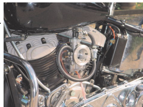
1939 ULH 1340ccm MM0023D

1121-39 Dichtung, Distanzstück / Mikuni-Adapter, Für Flathead-Modelle 1123-41 Anschlußschraube lang, Wird bei Verwendung des Distanzstückes 3x benötigt. 0259 Beilagring, für Anschlußschraube,